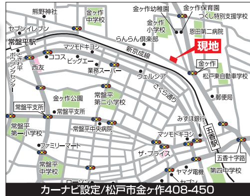
カーナビ設定/松戸市金ヶ作408-450

●総棟数/19棟●販売棟数/4棟●土地/124.38㎡(37.62坪)~127.33㎡(38.51坪) ●建物/96.47㎡(29.18坪)~101.02㎡(30.55坪)●間取/各4LDK(平成28年8月末日完成済) ●建確/第15UD11W建04351号他●用途/第一種低層住居専用地域●開発行為許可番号/松戸市指令第9号046(平成27年11月10日)●設備/公営水道・都市ガス・個別浄化槽●価格〈税込〉/2,380万円~2,980万円●所在/松戸市金ヶ作308-230他(専任媒介)